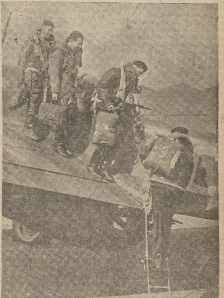
Almanya'ya yaptıkları bir seferden avdet eden İngiliz pilotları tayyareden inerlerken

Cenevre 23 (A.A.) — D. N. B. bildiriyor: Tevkifi evvelce bildirilmiş olan eski hava nazırı Guy la Chambre dün Biona nakledilmiştir. Guy la Chambre ve sabık hava nazırı Pier- re Cot mahkemeye sevkleri istenilen ve haklarında ilk tevkif müzaker- leri isdar olunan nazırlardır.