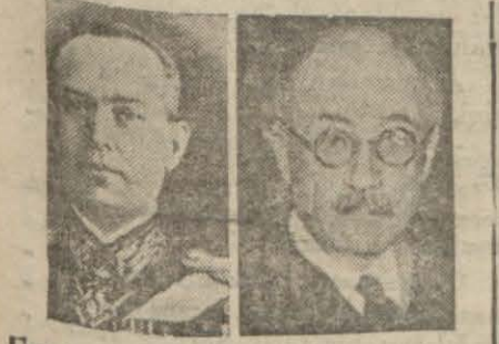
General Antonesko Kont Teleki

Diğer taraftan yakında bir Macar müesseli memleketimize gelecek Ankarada yerleşecek ve Türk - Ma- (Devamı 3 üncü sayfada)